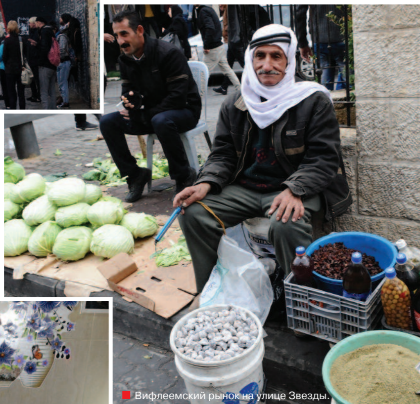
■ Вифлеемский рынок на улице Звезды.

Пасторальная картина Вифлеемских холмов сохранилась. Однако реальная жизнь в городе совсем неоднозначна. Постоянно ведутся споры, кто дольше живёт на этой земле и чья она. Вифлеем – важный город для евреев. В Вифлееме, согласно Библии, родился и был помазан на царство царь Давид. Он представляет собой образ идеального властителя, а также пророка и праотца Иисуса: из рода Давида в мир пришёл Мессия – Иисус Христос.