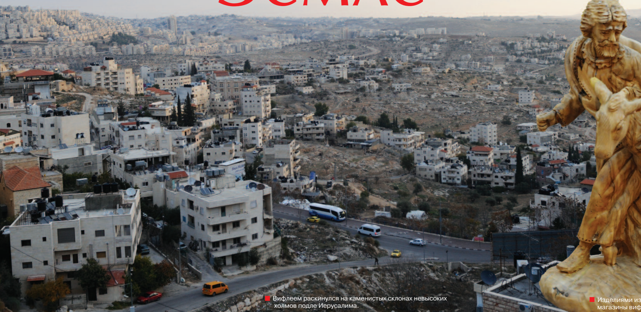
■ Вифлеем раскинулся на каменистых склонах невысоких холмов подле Иерусалима.

Храм Рождества Христова – не только уникальная святыня для христианства, построенная на месте, где, по преданию, родился Христос, но и одна из самых старых действующих церквей в мире. Первый храм был сооружён в 330 году по указу византийской царицы Елены, которой во сне было видение и наказ отправиться на Святую Землю и сохранить божественные места. Сын царицы, император Константин, поддержал миссию своей матери. С тех пор базилика неоднократно достраивалась и перестраивалась. И сейчас над ней возвышается кран, а внутри стоят строительные леса, и время от времени ведутся реставрационные работы.