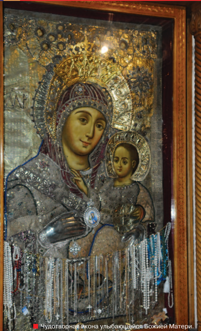
■ Чудотворная икона улыбающейся Божией Матери.