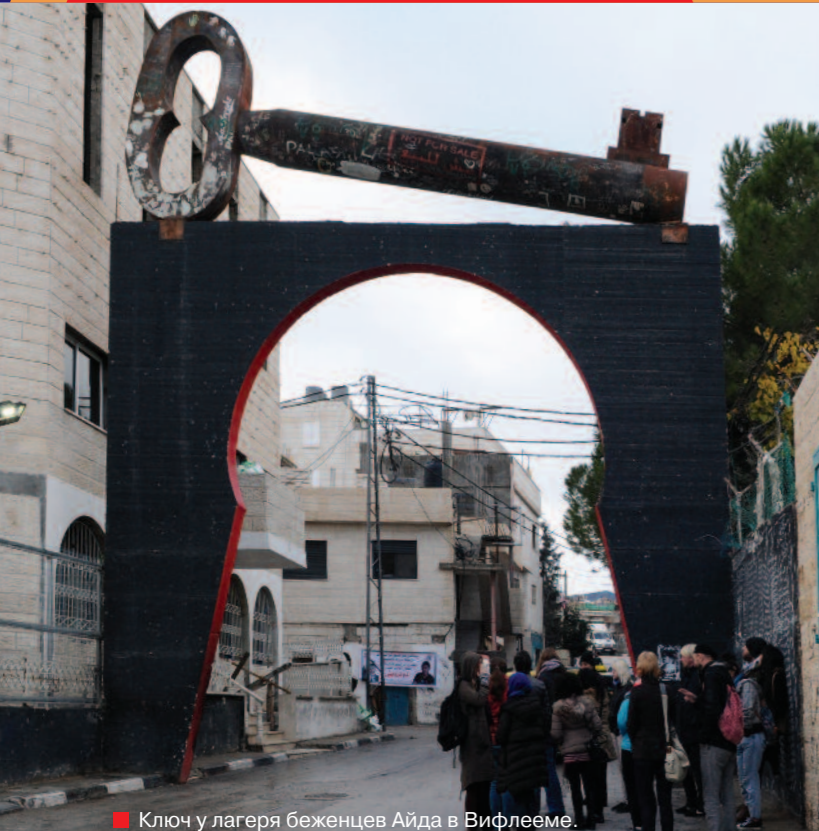
■ Ключ у лагеря беженцев Айда в Вифлееме.

Артефакты, собранные в музеях во время археологических раскопок, проводившихся, кстати, на Святой Земле издавна, относятся к разным векам и принадлежат разным народам, населявшим этот город. Напротив базилики стоит мечеть Омара, а на соседних улицах много церквей различных христианских конфессий. Местом паломничества является и гробница Рахели, праматери Дома Израилева, находящаяся близ Вифлеема. Это место свято как для евреев, так и для мусульман и христиан.