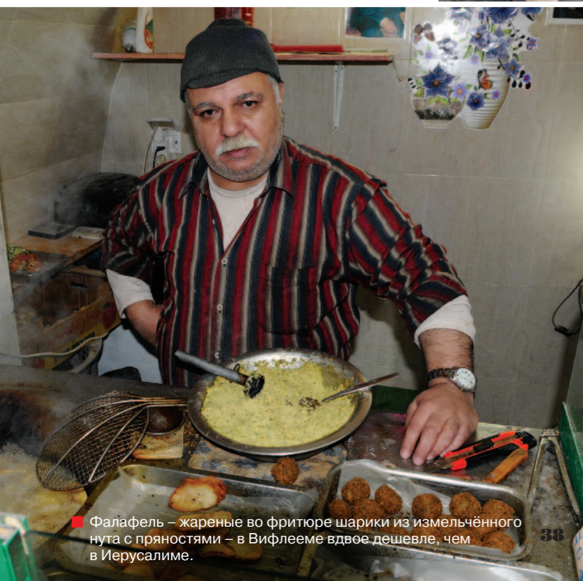
■ Фалафель – жареные во фритюре шарики из измельчённого нута с пряностями – в Вифлееме вдвое дешевле, чем в Иерусалиме.