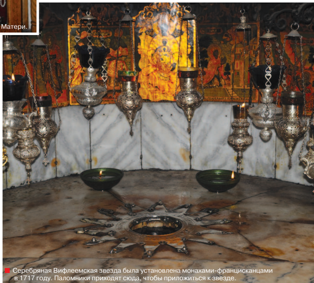
■ Серебряная Вифлеемская звезда была установлена монахами-францисканцами в 1717 году. Паломники приходят сюда, чтобы приложиться к звезде.

Святая святых Вифлеема – пещера Рождества Христова. Она находится под алтарём храма и отмечена серебряной звездой, в центре которой – отверстие древнего колодца. По преданию, на его дно упала Вифлеемская звезда. Считается, что если долго смотреть вглубь этого колодца, то можно увидеть мерцающий свет звезды. Рядом – придел Яслей, куда был положен Иисус после рождения.