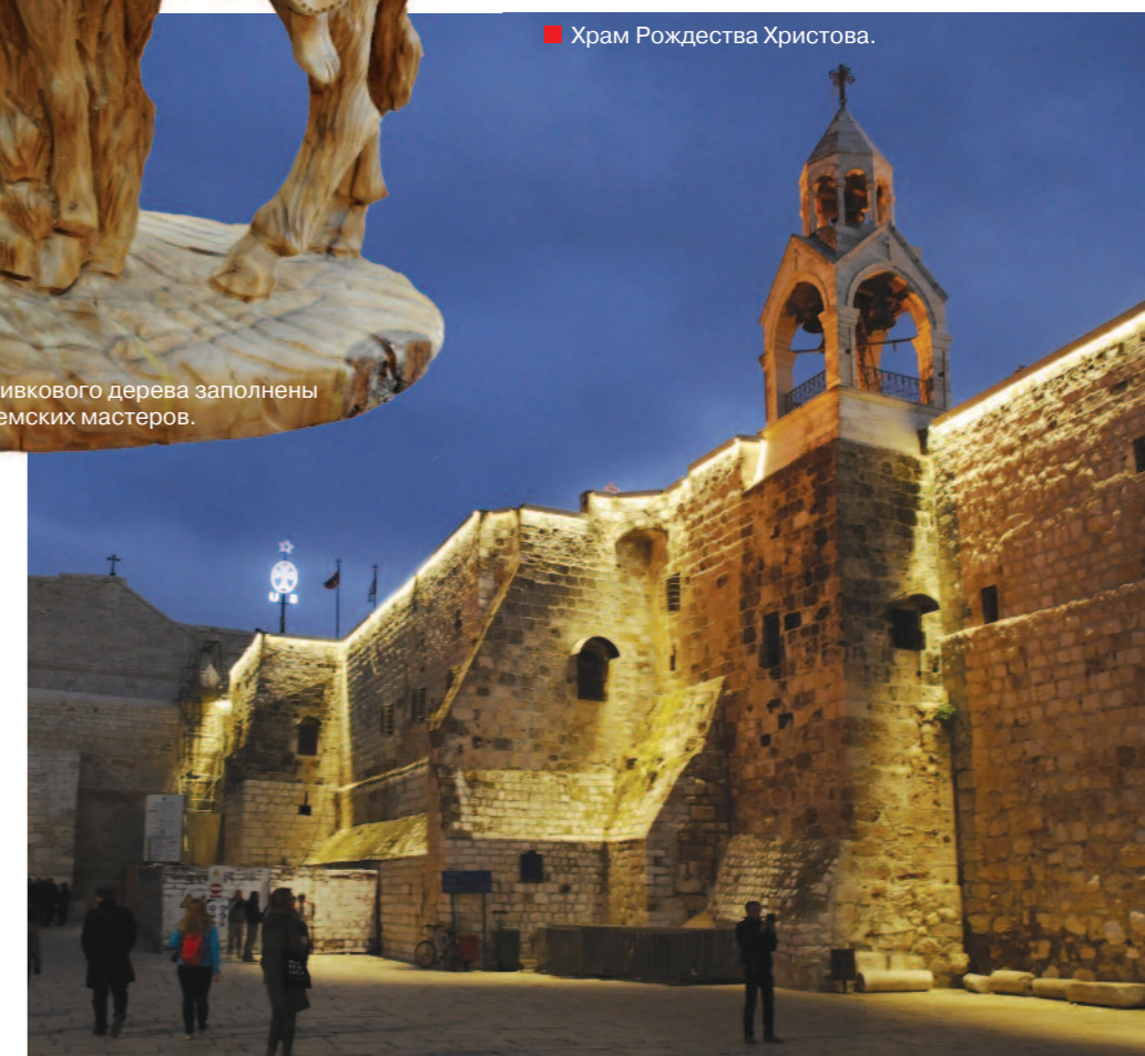
■ Храм Рождества Христова.