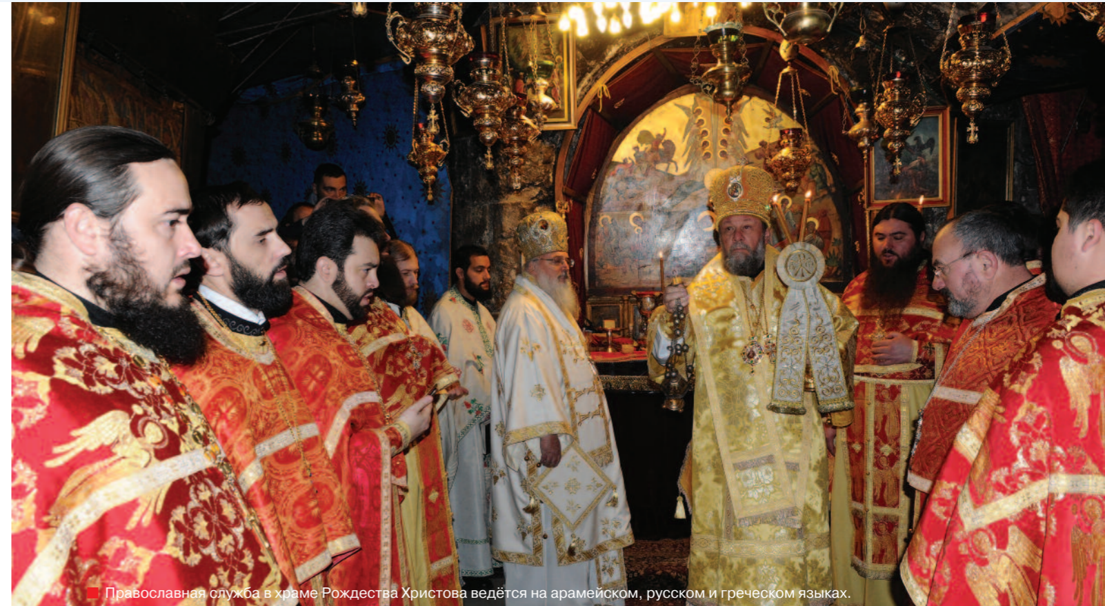
■ Православная служба в храме Рождества Христова ведётся на арамейском, русском и греческом языках.