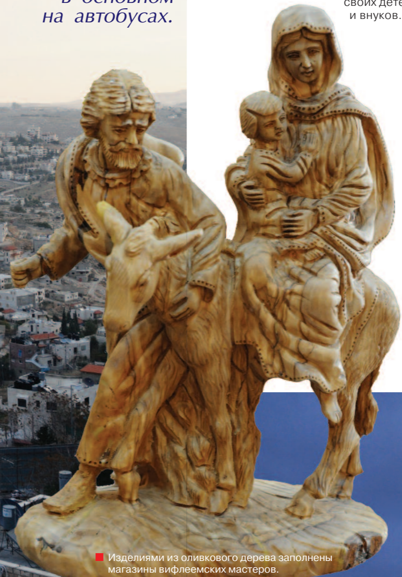
■ Изделиями из оливкового дерева заполнены магазины вифлеемских мастеров.