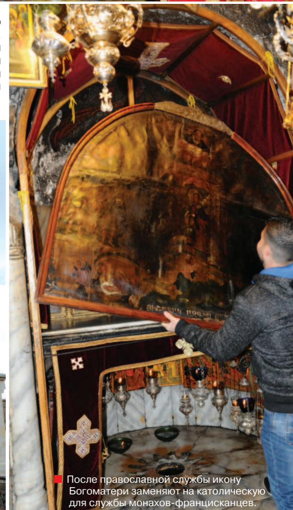
■ После православной службы икону Богородицы заменяют на католическую для службы монахов-францисканцев.